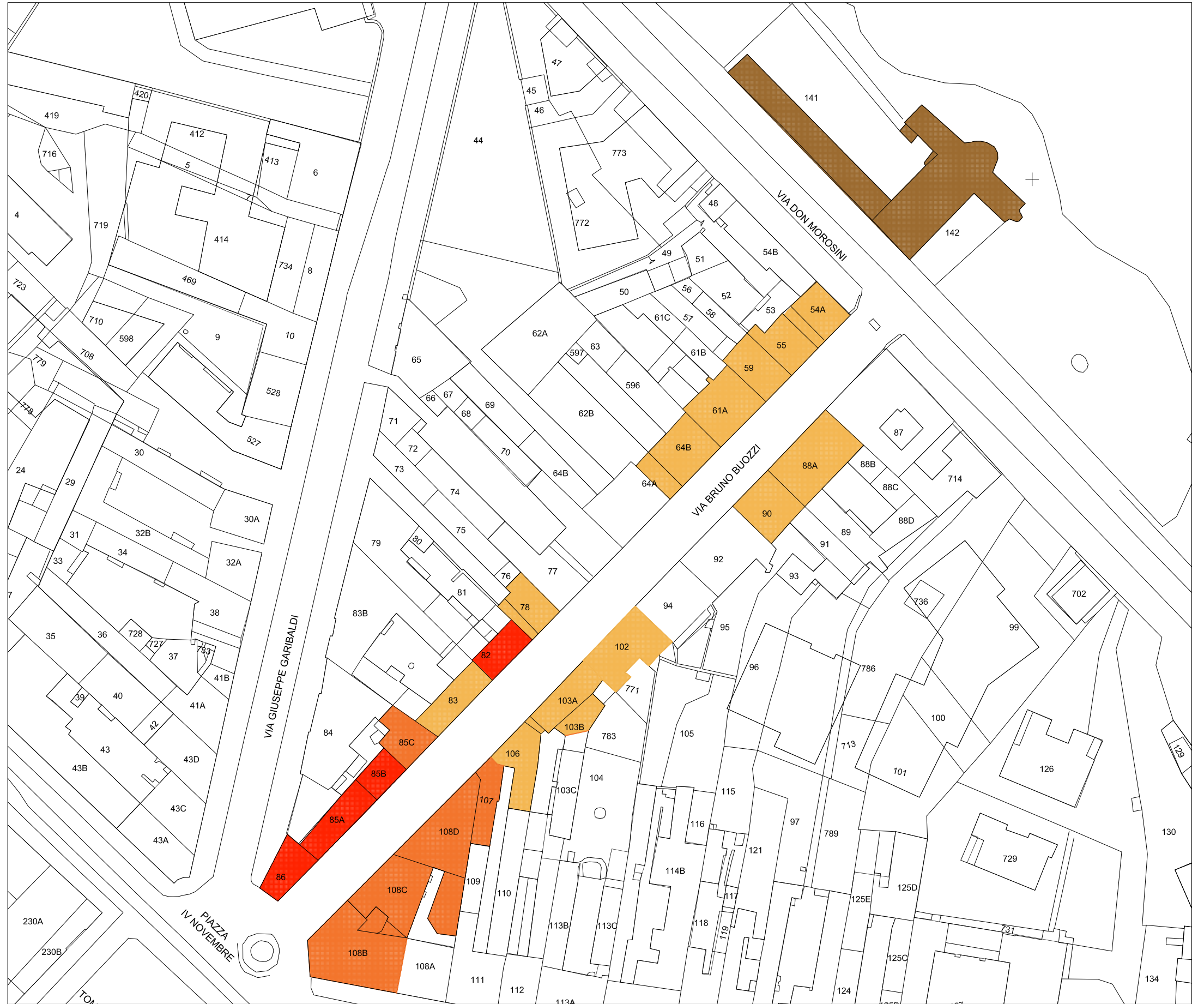
STRALCIO PLANIMETRIA catastale Rapp. 1/1000