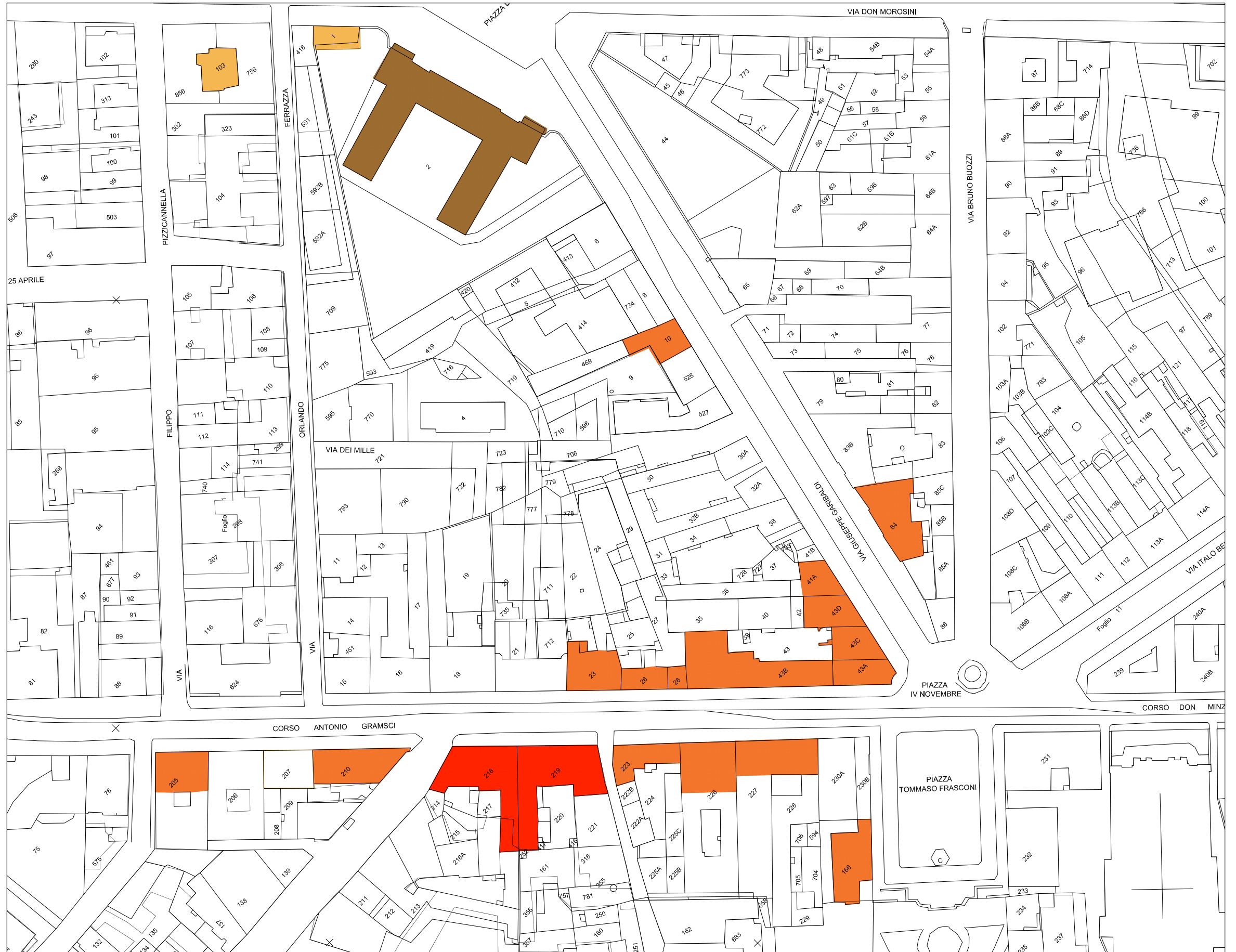
STRALCIO PLANIMETRIA catastale Rapp. 1/1300

EDIFICI PRIVI DI INTERESSE ARCHITETTONICO E STILISTICO