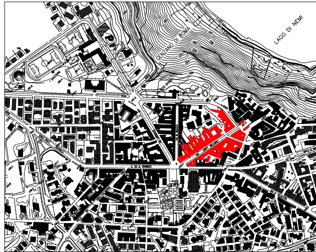
STRALCIO PLANIMETRIA AEROFOTOGRAMMETRICA