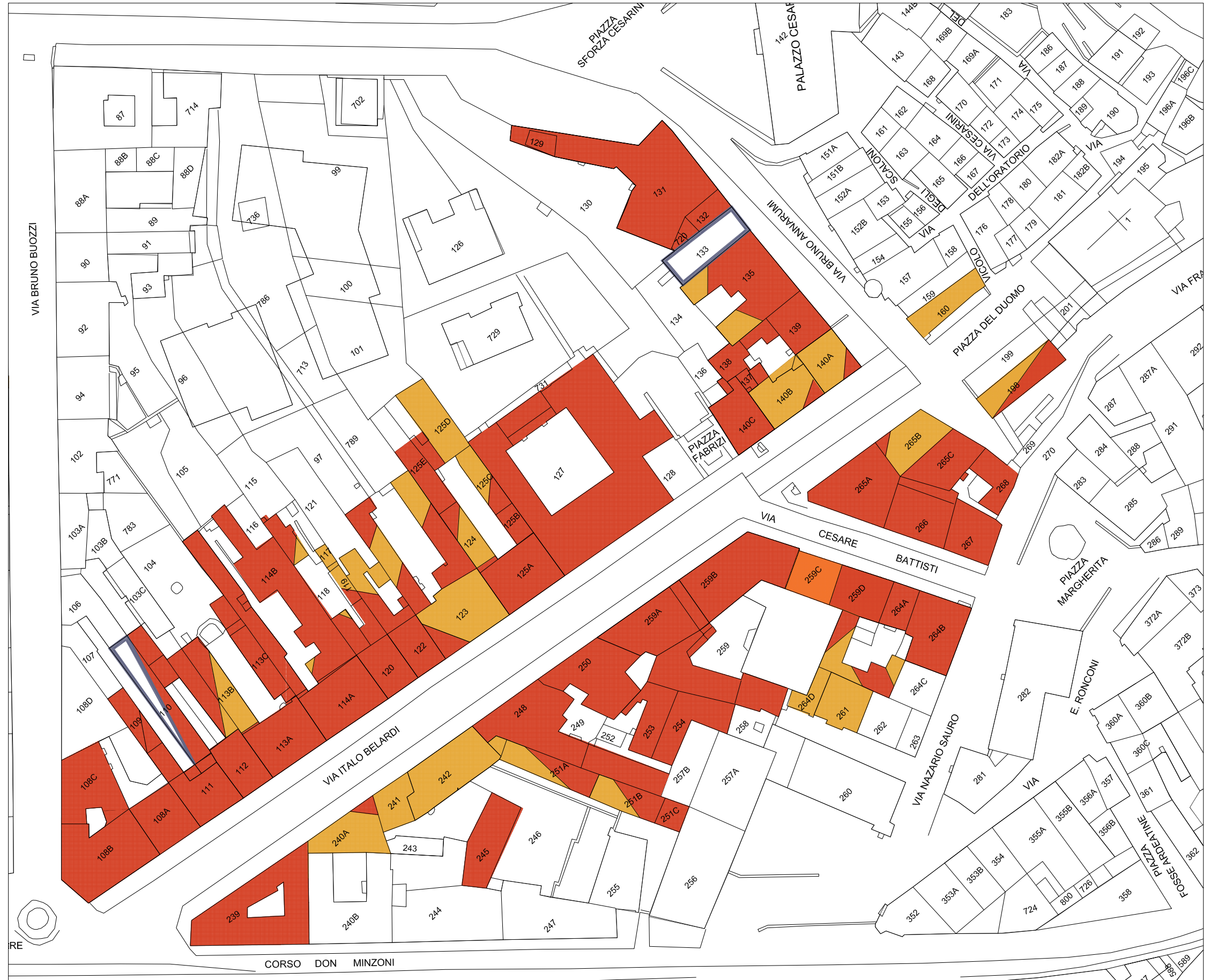
STRALCIO PLANIMETRIA catastale Rapp. 1/1000

PREVALENZA DI ALTRI RIVESTIMENTI (CORTINA LATERIZIA, TESSERE CERAMICHE ECC)