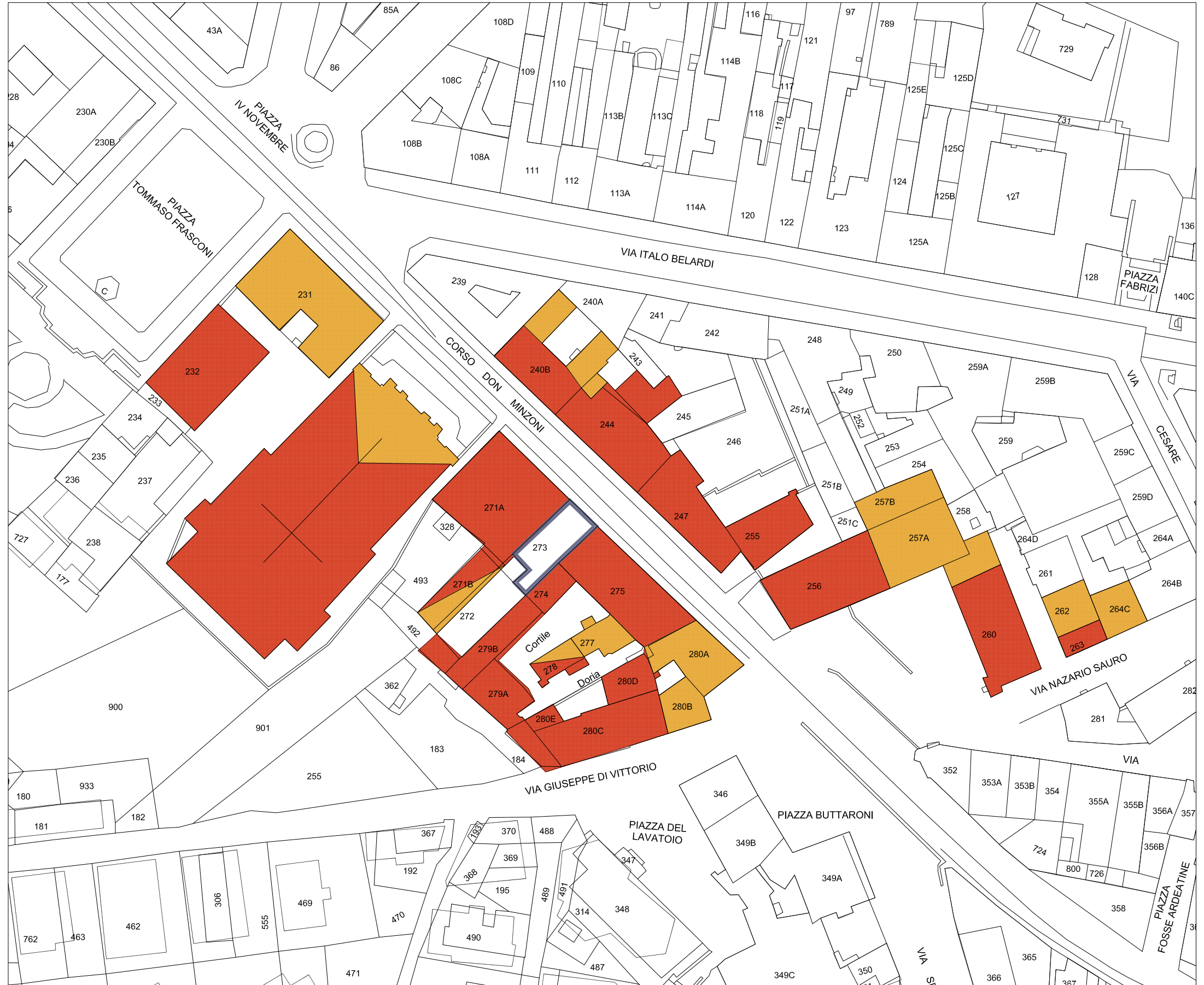
STRALCIO PLANIMETRIA catastale Rapp. 1/1000