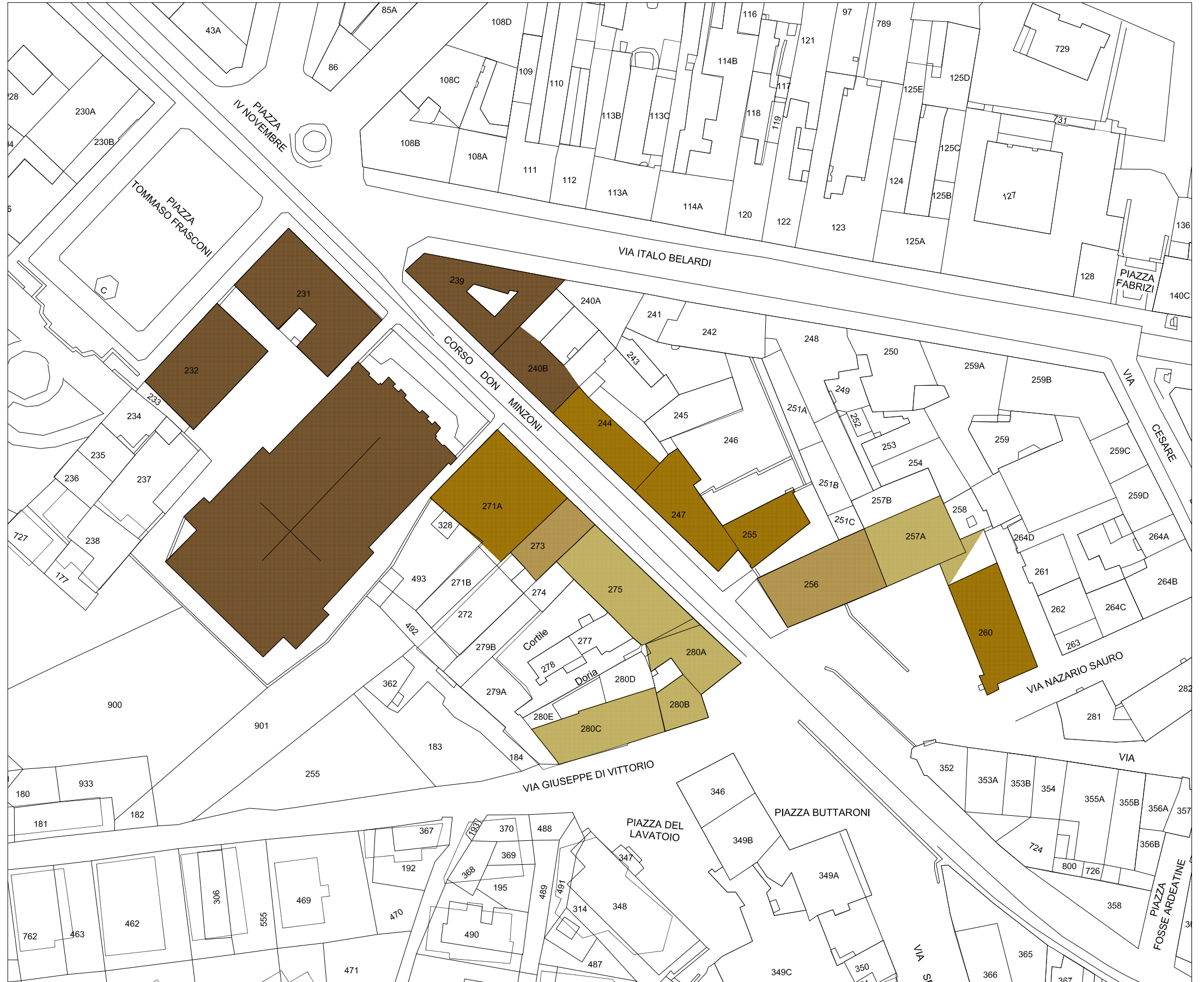
STRALCIO PLANIMETRIA catastale Rapp. 1/1000