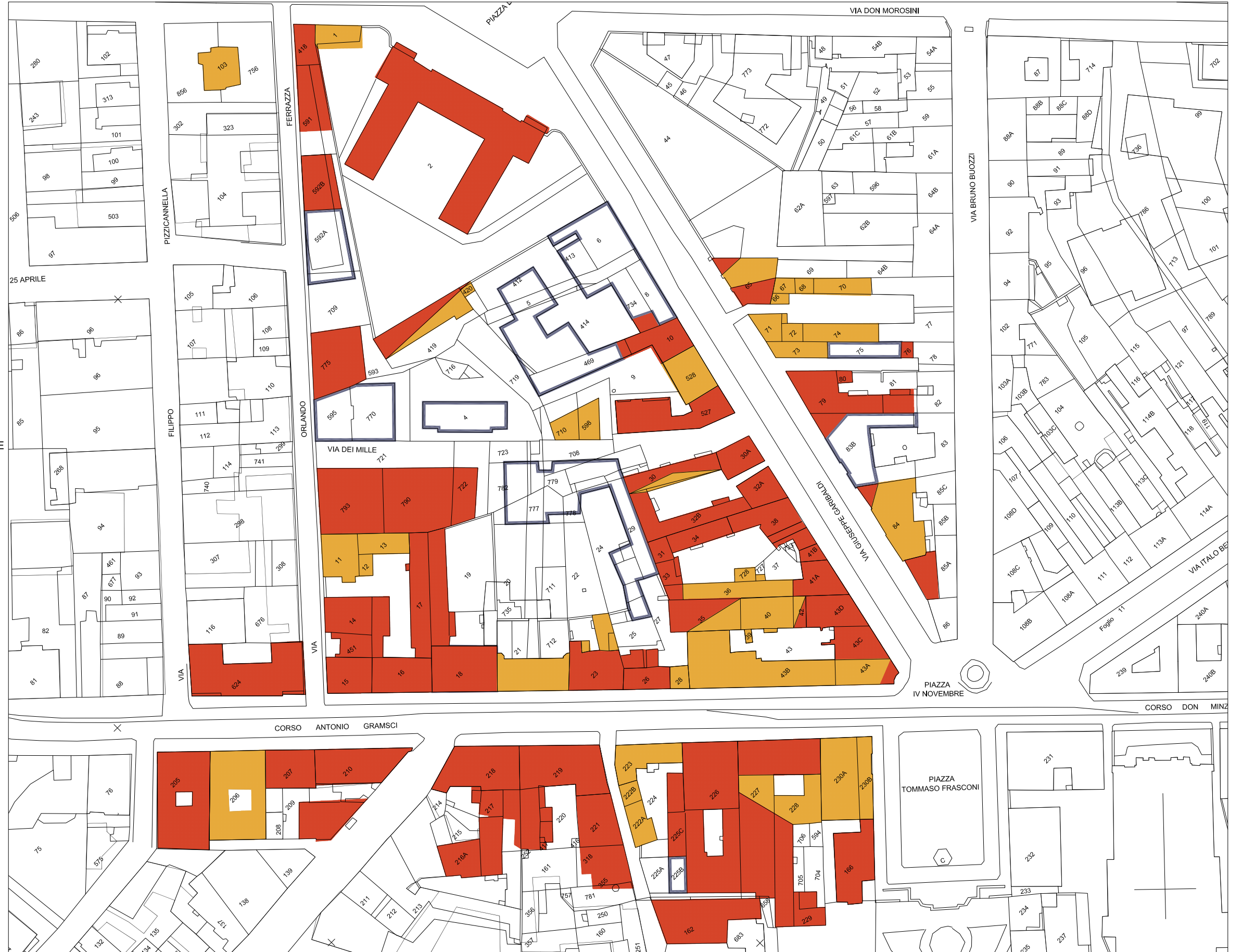
STRALCIO PLANIMETRIA catastale Rapp. 1/1300