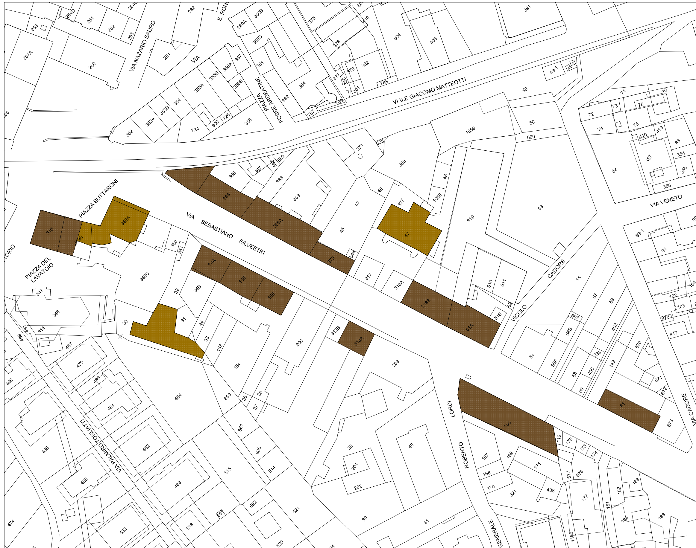
STRALCIO PLANIMETRIA catastale Rapp. 1/1000

PARZIALMENTE CONSERVATO IN SITO CON ELEMENTI RELITTI