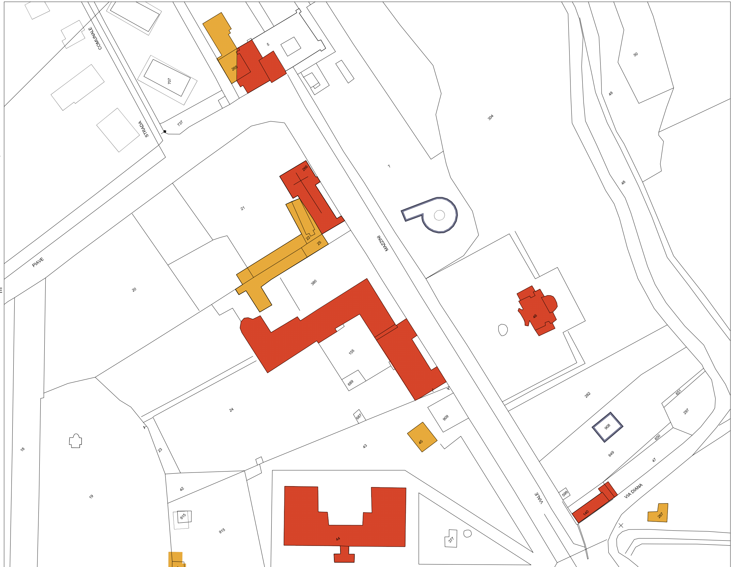
STRALCIO PLANIMETRIA catastale Rapp. 1/1300